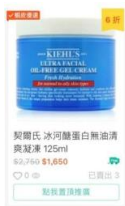
折扣價格 > 商品原價